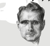
Märtyrer für Deutschland